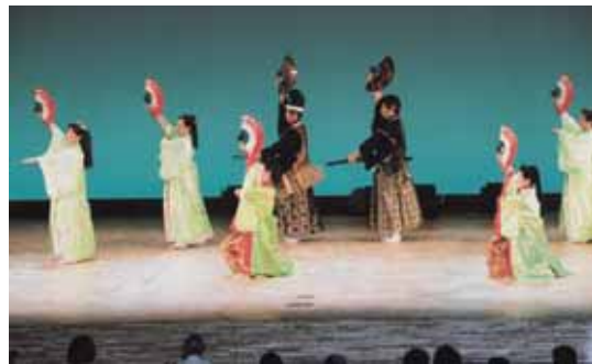
◀尾西市民会館にて

吟剣詩舞と聞くと、何かと取っ付きにくいイメージがあるかもしれませんが、近年は、古典ばかりではなく、童謡、日本の懐メロ、ポピュラーな曲も取り入れて皆様に親しんでいただこうと創意工夫をしています。