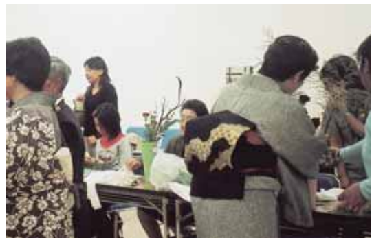
◀ 華道普及のための市民華道体験