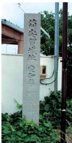
▶ 苧安賀城址碑（一宮市大和町）

苧安賀城は、戦国時代に織田信長の家臣・浅井新八郎によって築かれた城です。城は東西42間、南北32間ほどで内外二重の堀もあつたようです。現在、城のあつた場所は自動車教習場となつていますが、その傍らには「苧安賀城址」の碑が建つています。近年の発掘調査では、城の堀と考えられる