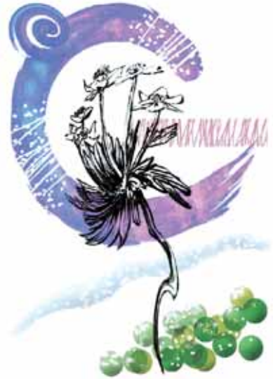
「早春図」 森 昭夫