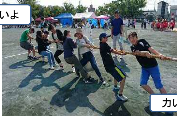
力いっぱい頑張りました