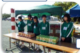
中学生も頑張りました