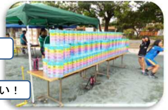
わ〜賞品がいっぱい！