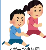
スポーツ少年団 運動適正テスト