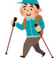
ノルディック・ウォーク体感講習会 (初心者を対象とします。)