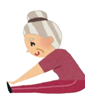
体力・運動能力調査

【主催】一宮市教育委員会 【主管】一宮市スポーツ推進委員連絡協議会 【協力】全日本ノルディック・ウォーク連盟(ミズノ株式会社)、愛知県スポーツチャンバラ協会、愛知県スポーツ吹矢協会 西尾張一宮支部、一宮市ショートテニス協会、一宮市アーチェリー協会、一宮市インディアカ協会、一宮市ベタンク協会、一宮市タスポニー協会、光明寺緑地パークゴルフクラブ、一宮市スポーツ少年団