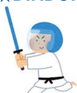
スポーツチャンバラ