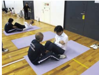
体力・運動能力調査