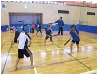
スポーツチャンバラ