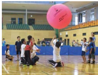
キンボールスポーツ