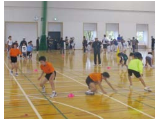
スポーツ少年団運動適性テスト