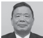
日比野 友治 (新国会)