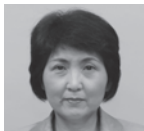
平松 邦江 (公明党)