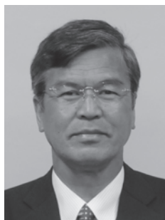
渡辺 宣之 (公明党)