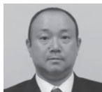
河村 弘保 (公明党)