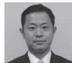
竹山 聡 (新国会)