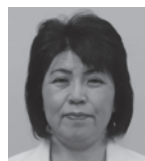
水谷 千恵子 (公明党)