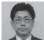
島津 秀典 (新国会)