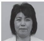
水谷 千恵子 (公明党)