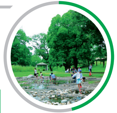
「水と緑が豊かな まちだと思う」 47.6%

レクリエーション・景観・防災など、さまざまな機能を持ち、私たちの暮らしにおいて欠かすことのできない緑地の適正な保全や緑化を、計画的に推進します。また緑化に関わっていない方が多いという結果もあり、引き続き啓発活動を行い、より身近に緑とふれあえる環境づくりを検討します。