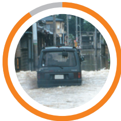
「想定外の自然災害が心配」 89.5%

「一宮市地球温暖化対策実行計画(区域施策編)」の改定に当たり、皆さんの地球温暖化についての意識などを把握し、実情に即した計画にするため聴きました。