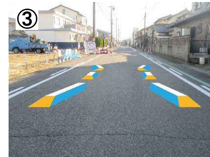
③ イメージハンプ【予定】