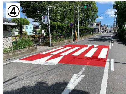
④ スムーズ横断歩道【予定】