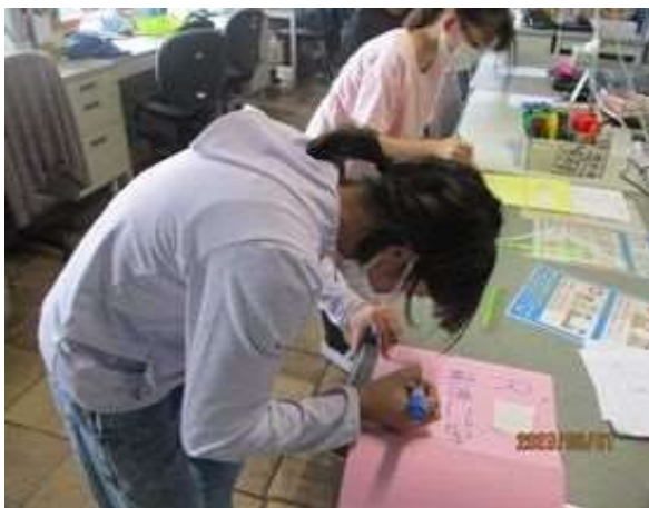
ごみ・リサイクルについての掲示物の作成