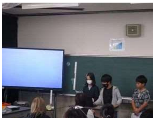
環境問題を学習発表で発表