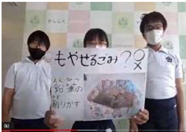
オンライン集会で呼びかけ

【その他の取組】 ・緑のカーテンを実施 ・4年生が夏休みに家族と協力してエコアップ行動に取り組む ・4年生が環境をテーマに学んだことを文化祭で発表