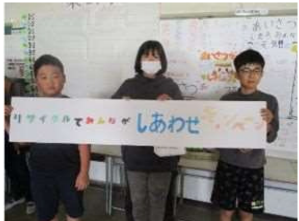
「リサイクルでみんながしあわせキャンペーン」