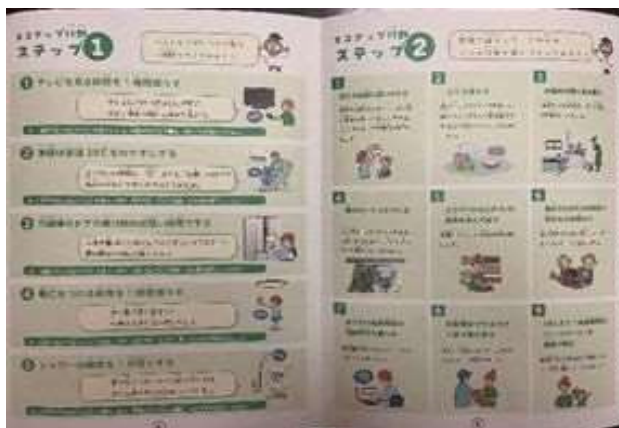
家庭でのエコアップ行動