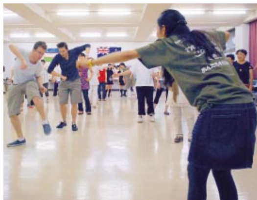
ウズベキスタンの男の踊りを体全体で表現