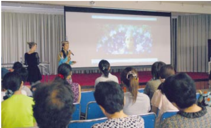
ダンスの歴史について講義