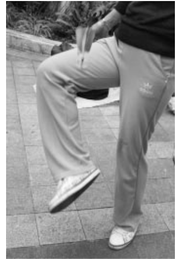
上手に羽根をリフティング

ほんの一時ですが、異国の地で現地の方と遊べるなんて思いもよりませんでした。それに、中国の人の気さくな人柄にも触れられ、とてもよい思い出が一つ増えました。あそびっていいですね。