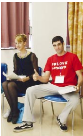
国際交流員2人が協力して 企画しました。