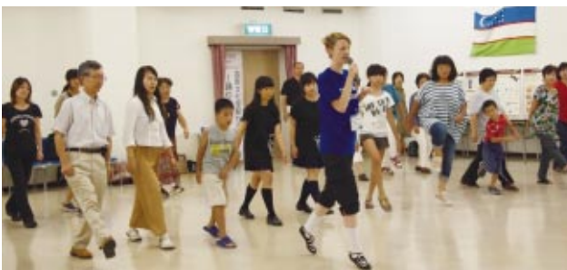
ワン!ツー!スリー!フォー!