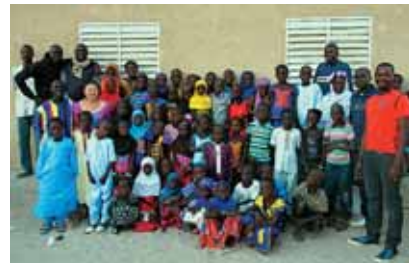
学習発表会、大成功!!

になり、おしゃべりを楽しむ、屈強な心をもったセネガル人に時には悩まされ、時には助けられながら、充実した時間を過ごすことができました。