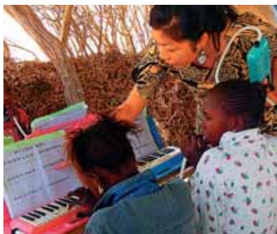
子どもたちにセネガル国歌を指導

できたときの笑顔はとてつもなくキラキラ輝いています。喜ぶときにはみんなが全力で喜び、踊りだす。明るく、陽気で、だれとでもすぐ友達