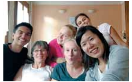
ホームステイ先での他の学生との写真

当初は3週間だけのホームステイの予定が気付けばすでに半年近く経っている。その間に20人以上の学生がホストファミリー宅に滞在していた。彼らとの出会いも私のフランス生活の思い出の一つである。海外の友人は「またね!」と言っても、再会の保証はない。だからこそ一緒にいられる「今」がいかに重要か。無理をしてでも時間を作り、会える時に会うことの大切さを強く感じている。そうして築いた絆を大事に、残りの期間のフランス生活も楽しく過ごしていきたい。