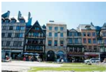
ノルマンディ特有の木組み家の町並み

そして現在は、学校に通いながら日本食レストランでウエイトレスとして働いている。「日本食レストラン」なのに日本人は私だけ。同僚の言っていることやお客さんの注文が聞き取れず苦勞することも多い