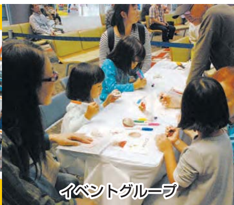
イベントグループ