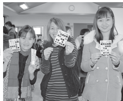
これが揃ったカードです！

日本語教室では現在、ボランティアを募集しています。興味のある方はiia事務局までお問い合わせください！