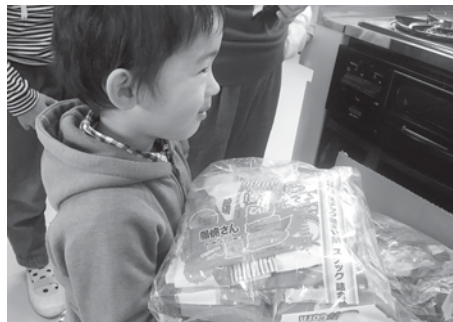
大きなクリスマスプレゼントをもらいました。