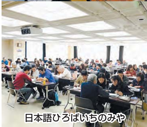
日本語ひろばいちのみや