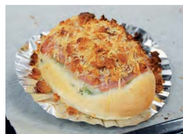
ルッコラ&生ハムのフォカッチャ (パルメザンパン粉がけ)