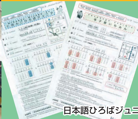
日本語ひろばジュニア&寺子屋いちみん