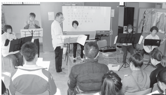
“四季の歌”をみんなで歌いました。

いつもの日本語を教える、教えられるの立場を超えて共に楽しい時間を共有しました。遊びあり。歌あり。日本語でのスピーチあり。ミニコンサート、そして賞品多数のビンゴで楽しい時間を過ごしました。(佐野)