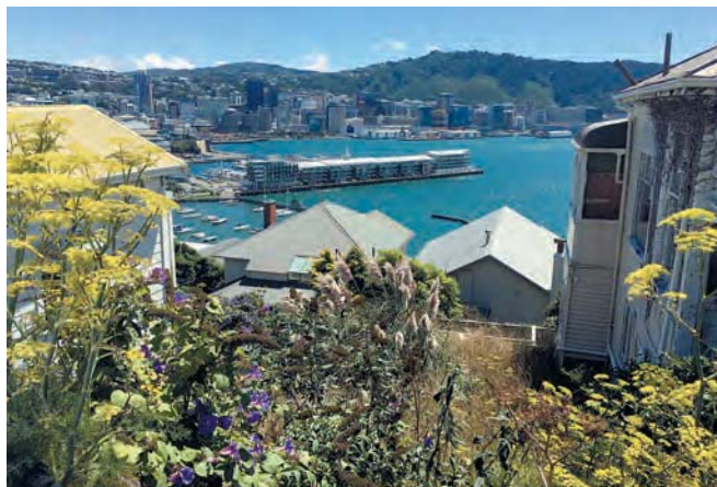
ウェリントン市街地の風景

本当に一宮で過ごした時間は、楽しいだけではなく、自分の将来にも大きく影響をしていました。感謝と幸せな思い出でいっぱいです。ありがとうございました。また必ず一宮市に行きますから、よろしくお願いします！