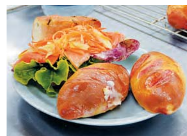
左: イタリアンパセリのチャバッタサンド (スモークサンドとフィノッキオ) 右: ビーツとクランベリーのスイートブレッド

市内にあるブルーランジュリー アヴェックのシェフ 上村昭博さんをお迎えし、イタリア野菜を使ったパン教室が開催されました。