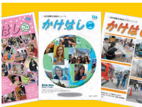
ニュースグループ