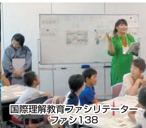
国際理解教育ファシリテーター ファシ138