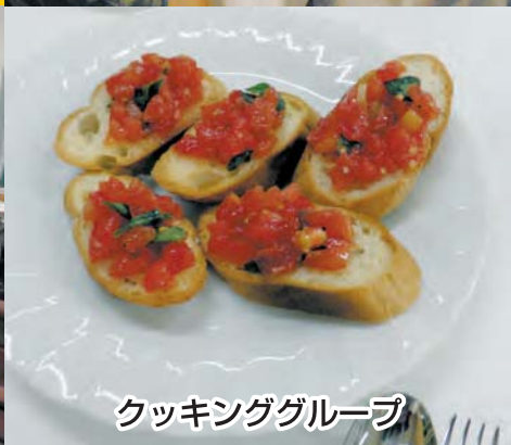
クッキンググループ