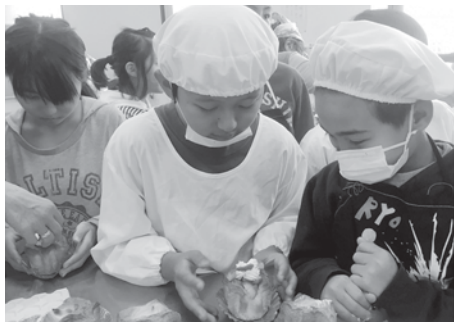
クリスマスパイケーキを、自分で作って食べました。

外国人の子どもたち向けの日本語教室2つ合同でクリスマス会をしました。クッキング班手作りのごちそうに、子どもたち大さわぎです。(ゆご)