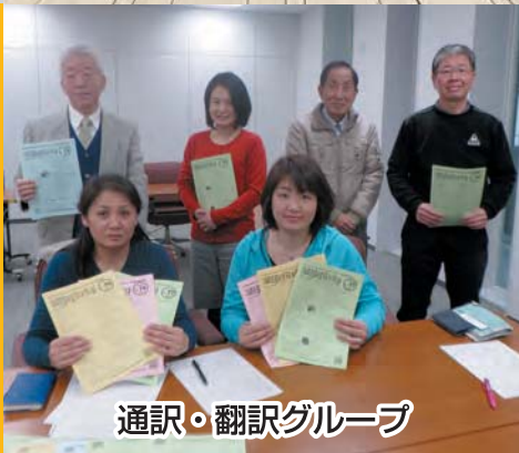
通訳・翻訳グループ

みんな国際交流協会 ボランティアの仲間！ 2018年も協会を中心に 世界と繋がり盛り上げて いきます。