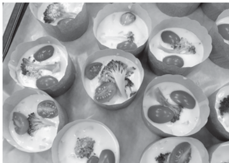
惣菜マフィンをこれから焼きますよ。