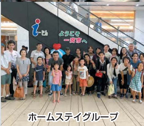
ホームステイグループ