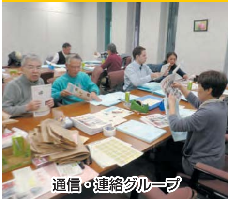
通信・連絡グループ