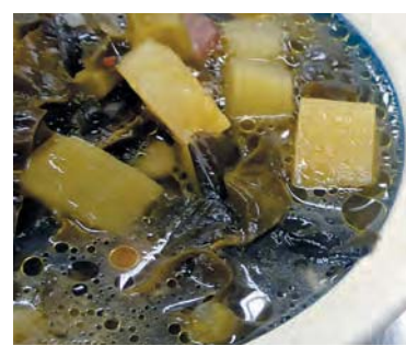
黒キャベツとラディッシュを使ったスープ