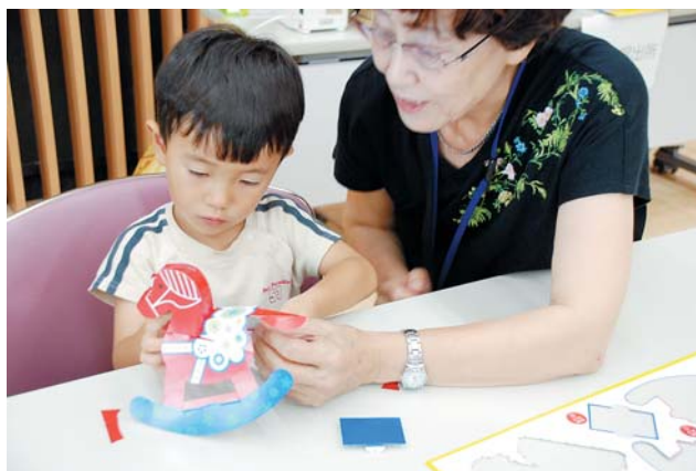
ダラナホース貯金箱作り クラフト体験

世界をまなぼう！ 七夕グローバルサマーセミナー 2018.7.25 一宮市役所にて