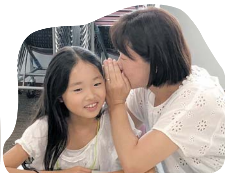
イタリア文化をまなべる伝言ゲーム