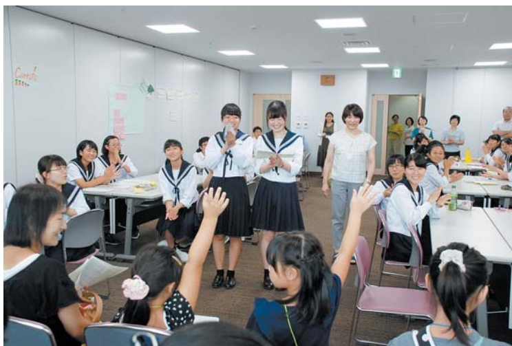
愛知県立一宮西高等学校 国際理解コースのみなさん