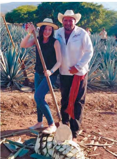
テキーラの原料マゲイの農園の方と

メキシコへ来た当初は初めての海外生活、メキシコという国に慣れず戸惑いの連続でした。特に言葉の問題。メキシコの共通語はスペイン語です。レストランやスーパーでは基本的にスペイン語しか通じません。初めてメキシコ料理を注文した時、店員さんに何度も「これでいいの？本当にいいの？」と聞かれました。そうして出てきた料理はバッタまみれでした。(バッタはメキシコの伝統的な栄養食です)その後も