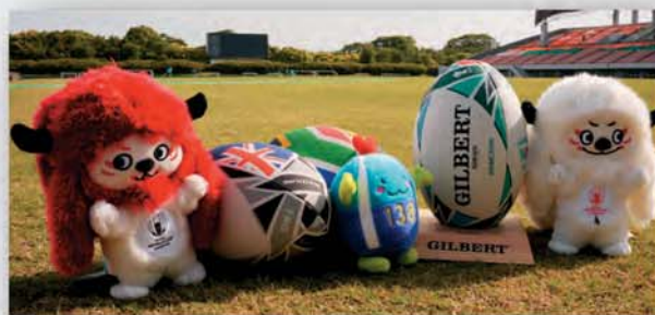
TM © Rugby World Cup Limited 2015. All rights reserved.