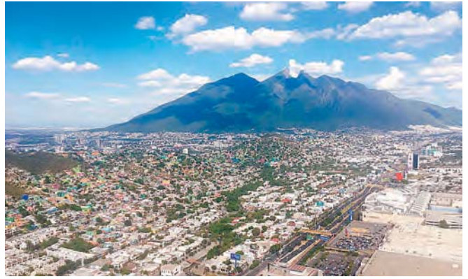
モンテレイを象徴する山、セロ・デ・ラ・シージャ(鞍の山)

店員さんは私たちをからかって何度も美味しいかどうか聞きにきました(笑)。その日から私は生きていく為にスペイン語を頑張ろうと固く誓いました。他にも、信号の停車中に窓拭きをしてお金を要求する人がいたり、レストランの食事中に下水が逆流して水浸しになったり、