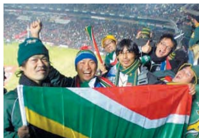
一度ラグビーを観戦したヨハネスブルグのスタジアム

東部にあるムプマランガ州マレラネ地区に住んでいました。州都はショッピングモールもある都会ですが、私の町は田舎で断水や停電は日常茶飯事。一方で携帯電話の普及率は高かったです。田舎な分、犯罪は少なく穏やかでしたが、夜になると稀に銃声が聞こえました。