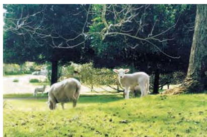
緑豊かな都心の公園には羊や牛も放牧されています

NZでは色々な場所に旅行しましたが、南島のLake Tekapo(テカポ湖)がお気に入りです。夜に無数の星が見えた時は感動しました。