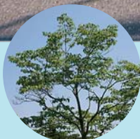
市の木 ハナミズキ