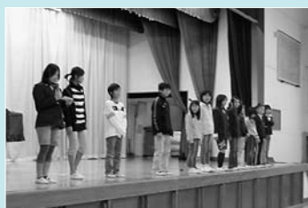
ごみ減量や省エネを呼び掛ける全校集会（中島小）