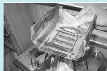
ペットボトルを再利用して作ったスポンジ置き（起小）