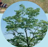
市の木 ハナミズキ