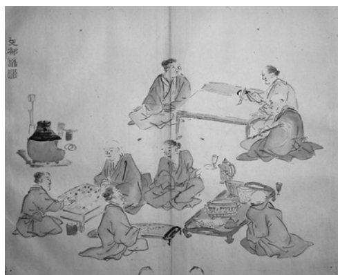
▼「有隣舍同人琴棋書画の図」 種徳堂画帖より(個人蔵)