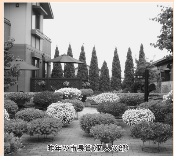
昨年の市長賞(個人の部)