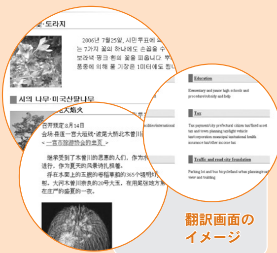
翻訳画面の イメージ

なおシステムを利用して機械的に翻訳を行っているため、100%正確な翻訳であることは保証できません。誤訳があった場合は、順次改善していきます。