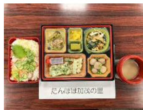
たんぱぼ加茂の里