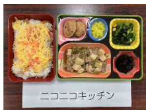
ニコニコキッチン