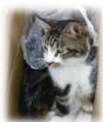
ネコも立派なスタッフ！

「傘をさして歩く」という当たり前のことをきちんと練習し、日常生活を送る上で少しでも困らないようにするという支援が大切にされていることもわかりました。なかなか支援をしても落ちつかなかった方が、つい最近数字が好きだとわかり、取り組みに加えることで落ち着いてきているといったお話もあり、働くスタッフは大変だけど、子供たちと一緒に学んでいく姿勢を大切にされており、とても温かい雰囲気の仕事所でした。