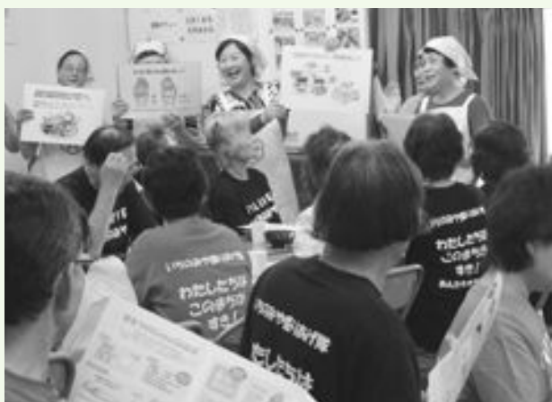
食生活改善推進員の活動の様子