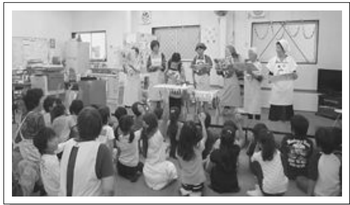
エプロンシアターの様子

親子クッキング エプロンシアター レディースクッキング 男の料理教室 ふれあい昼食会 健康まつりへの参加 など