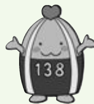
一宮市マスコットキャラクター「いちみん」