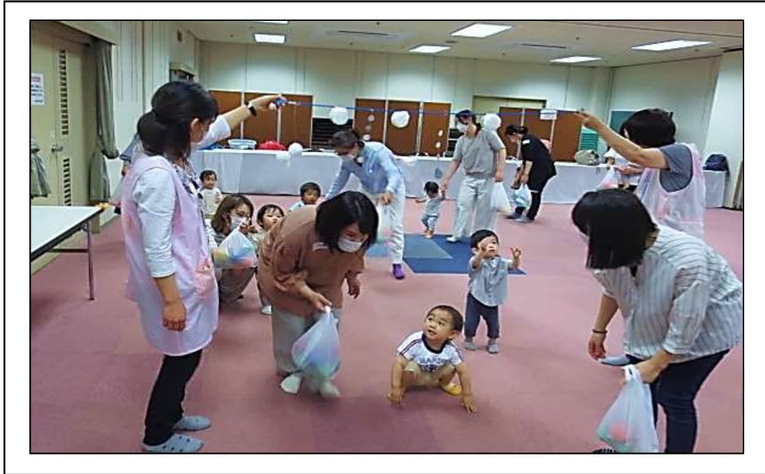
「ママといっしょでいいな」にて