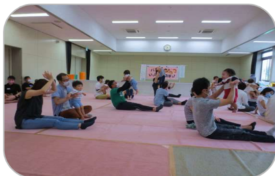
<東五城子育て支援センターにて>