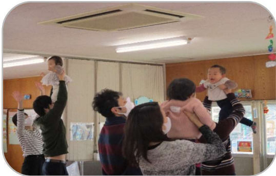
<里小牧子育て支援センターにて>

普段、全身を使って娘と遊ぶ事がないので、とても楽しく参加することができたと同時に、自分の老いにも気づかされました。