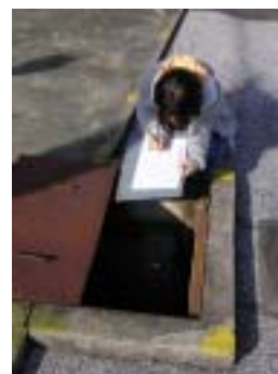
水道メーターチェック