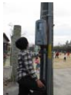
電気メーターチェック

子どもたちの環境に対する意識を高めるために、ごみ減量や電気や水道の節約に取り組む「いちのみやエコスクール運動」に市内のほとんどの小中学校が参加し、「地球にやさしい学校」として認定されました。