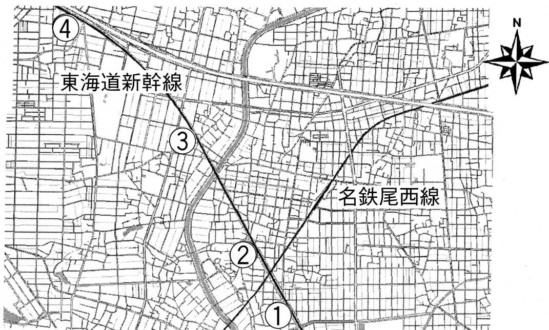
図-4 新幹線鉄道騒音調査地点