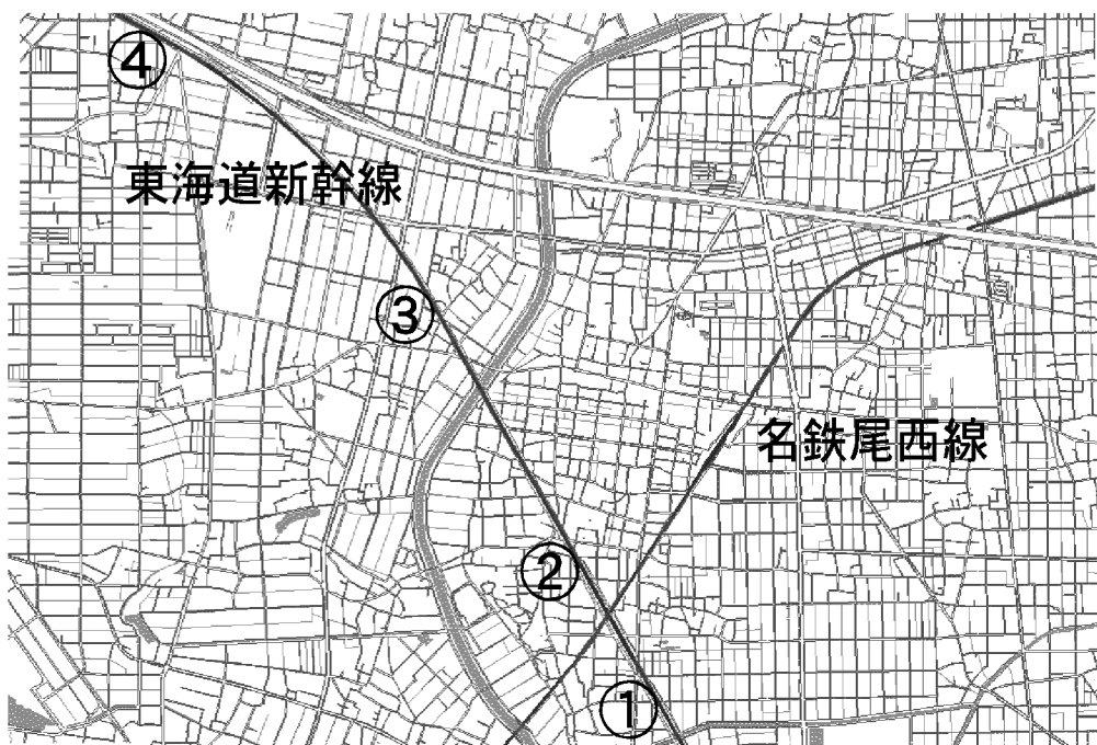
図-4 新幹線鉄道騒音調査地点