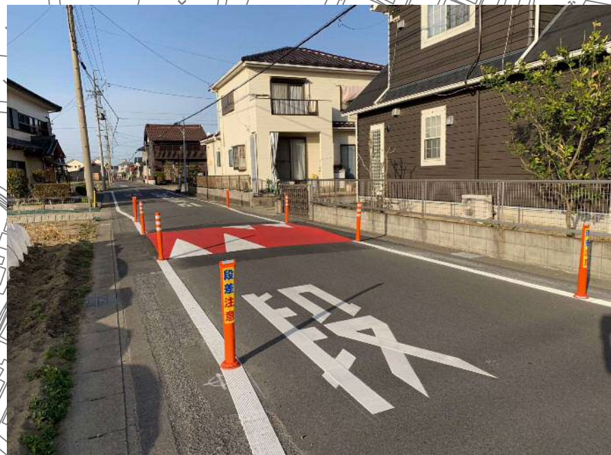
単路ハンプ R3年度施工