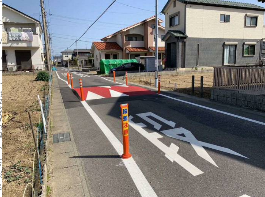
単路ハンプ R3年度施工