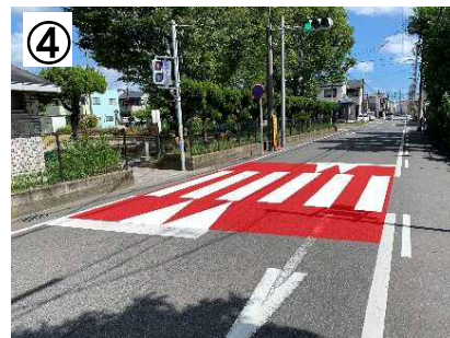
④ スムーズ横断歩道【予定】