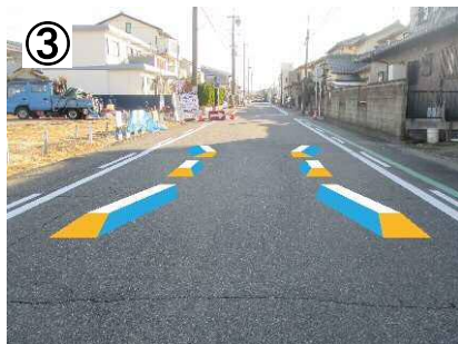
③ イメージハンプ【予定】