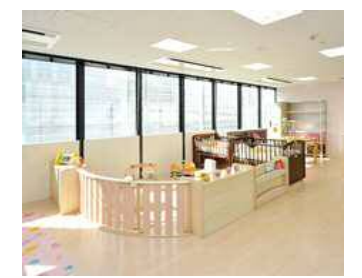
●子ども一時預かり施設