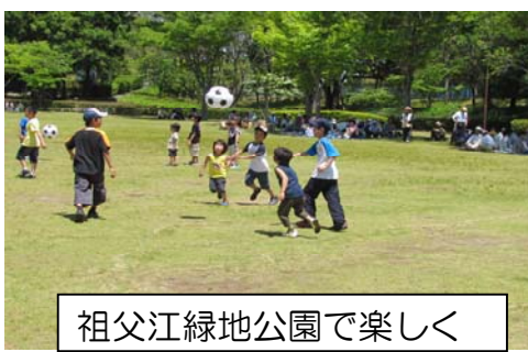
祖父江緑地公園で楽しく