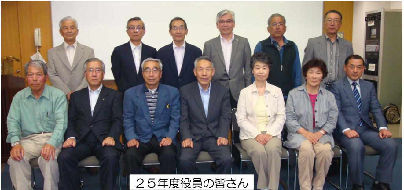
25年度役員の皆さん