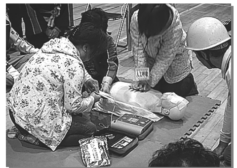
婦人防災の皆さんの指導で、AED救命法の体験