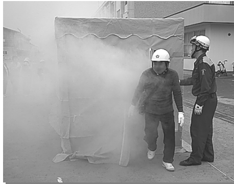
煙体験で火災時の避難の難しさを体験