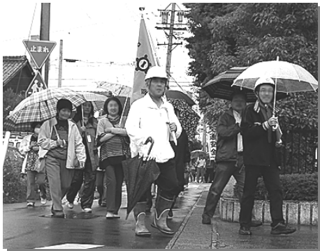
避難場所までの道のりを各町内が確認しながら参加しました

3月11日の東日本大震災のあまりにも大きな災害に、強い恐怖感を覚えられた方が多いと思います。そして、その災害後に行われた今回の防災訓練では「奥町連区町会長会」「奥町連区自主防災会連絡協議会」の皆さんで準備された、いろいろな防災訓練内容を、各町内の参加者が真剣に取り組んでいました。