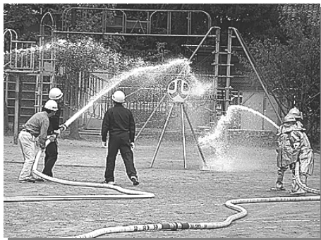
自主防災会と消防分団による放水訓練