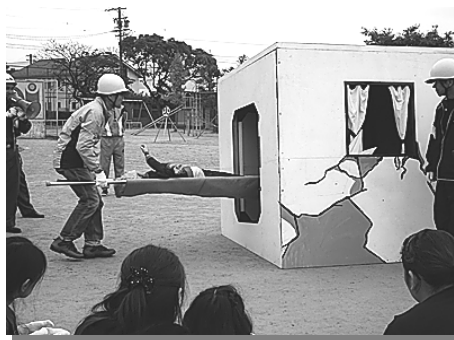
倒壊家屋からの被災者救助の体験