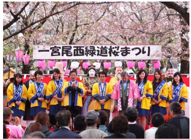
(平成25年4月7日尾西緑道にて)