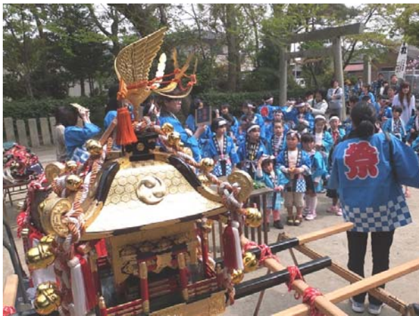
(平成25年4月14日那迦島神社にて)