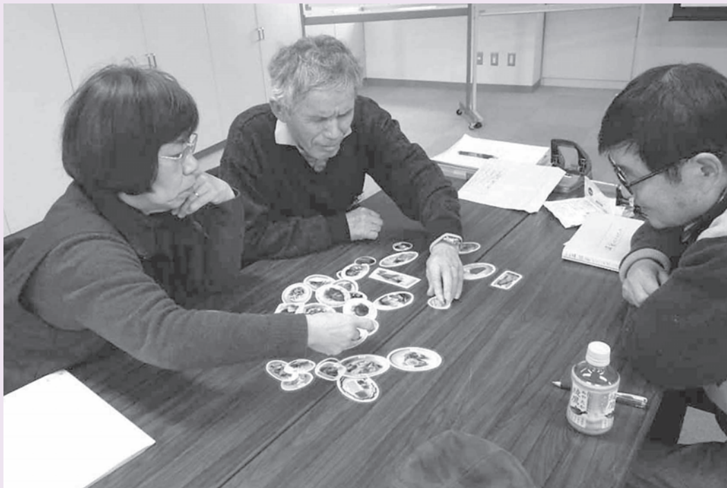
健康づくりサポーター養成講座(バランス食についてのグループワーク)の様子