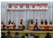
奥風太鼓でフィナーレです