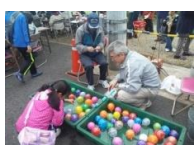
水風船コーナーもあったよ