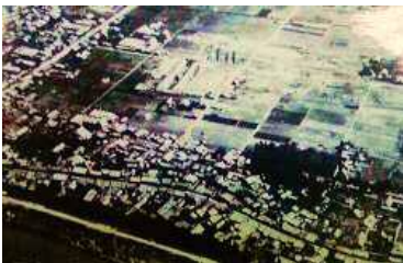
C 中央上部は起小学校