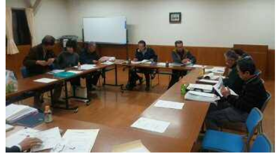
公民館事業の会計監査風景

さし当たり、公民館は事業数も多く大変な作業だったと思います。各役員様、一年間お疲れ様でした。そして、新しく役員になられた方、よろしくお願ひします。