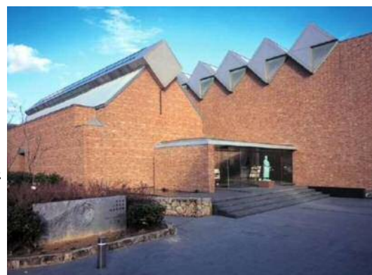
三岸節子記念美術館

わたしたちの連区にある三岸節子記念美術館に一度と言わず足を運ばれたらいかがでしょうか。