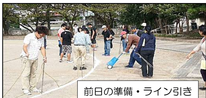
前日の準備・ライン引き

9月20日（日）朝日東小学校で、快晴の秋空の下、約2,500名の方々の参加のもと、体育祭が開催されました。