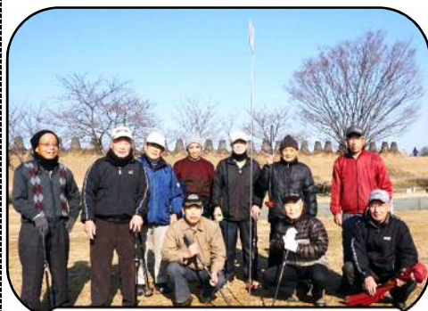
寒い日でも頑張ってます