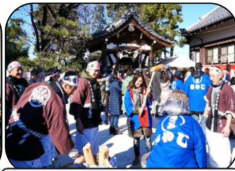
女性もヨイショ ヨイショ