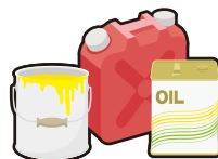
塗料や廃油等(液体)