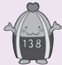
一宮市マスコットキャラクター「いちみん」