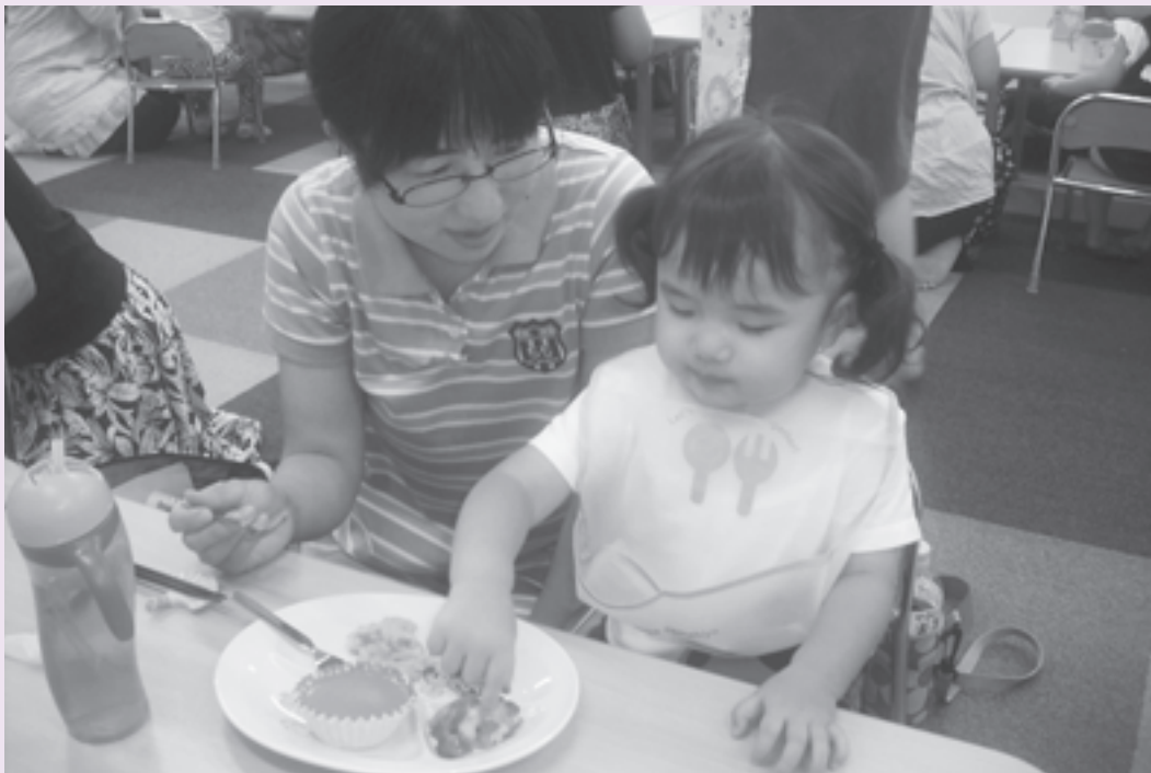
にこにこ★ぱっくん幼児食教室の様子