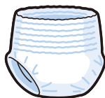
纸尿裤 ※请除去秽物