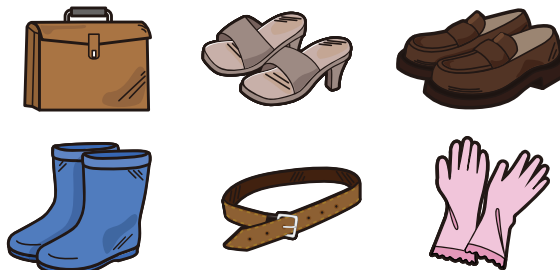
革制品、皮包、皮鞋、雨靴、皮带、橡胶手套