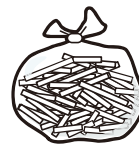
碎纸机纸屑 ※请用水润湿