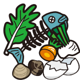
蔬菜残渣、剩饭、鱼骨头