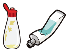
色拉酱软瓶、牙膏软管