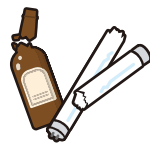
碎了的玻璃瓶 碎了荧光灯管