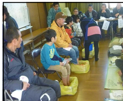
ダンボール箱で足湯が！