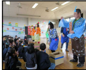
先生がお内裏様とお姫様！

今年も児童館でひなまつりお楽しみ会が開かれました。会場には工作教室で作られた色とりどりのひな人形がたくさん飾られ、かわいい雰囲気工夫されていました。ペープサート劇「ひな祭りってなあに？」で、雛飾りやひし餅・桃の花を供えることの由来にまつわるお話がされました。どの子も姿勢よく静かに聞く態度ができていて、児童館の先生方のご指導の様子が伝わってきました。その後、○×クイズやひしもち積みレースなどで楽しみました。