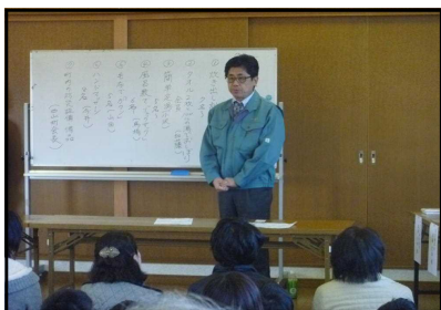
島津市議も参加されました！

今後は毎年各町内で実施していきたいとのこと。この地域一帯もいつ大きな地震が起きてもおかしくない状況だと言われています。東北大震災発生から5年たった今でも避難生活をまだ続けている方もいるということを知り、今回のような日頃からの備えが大切だと実感します。