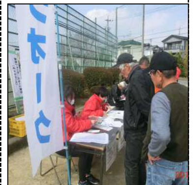
(朝日公民館魅力部)