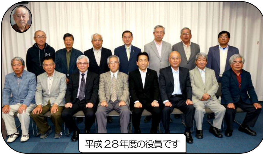
平成28年度の役員です

5月11日(水)に第1回生活安全部会・福祉部会・健康づくり部会の3部会が開催されました。