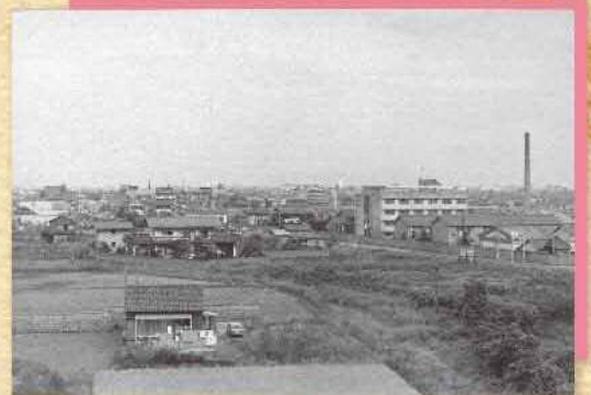
▲③木曾川町舎よりの風景