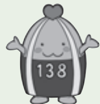
一宮市マスコットキャラクター「いちみん」