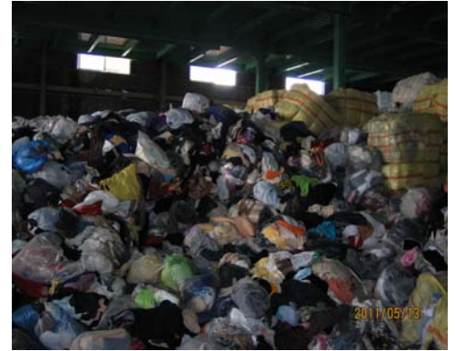
◇高くつまれた古着の山