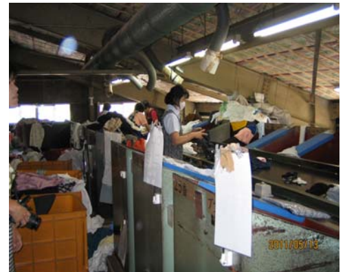
◇選別の様子(※色と素材で細かく選別)