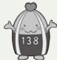
一宮市マスコットキャラクター「いちみん」