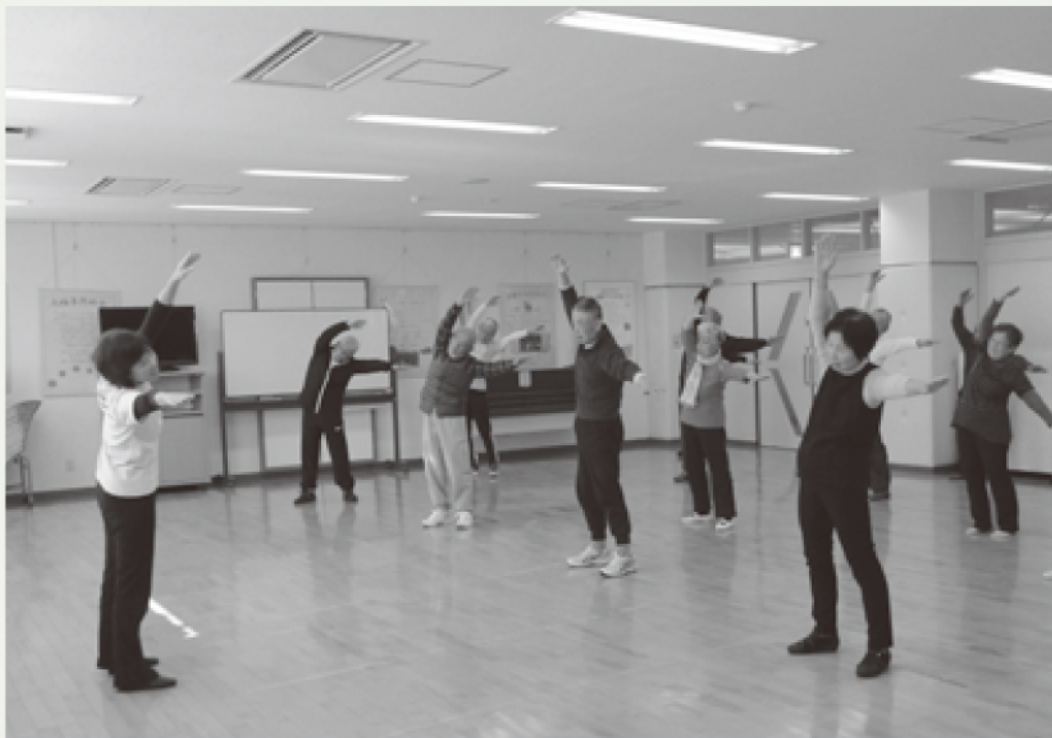
すっきり!運動教室の様子