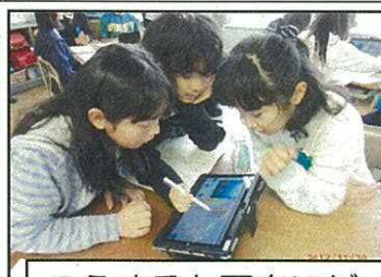
こうすると面白いゲームになるよ