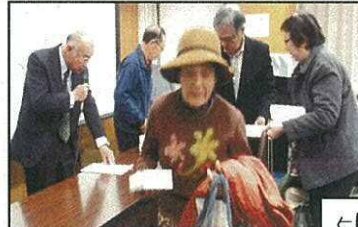
いっぱい勉強しました