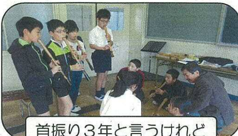
首振り3年と言うけれど