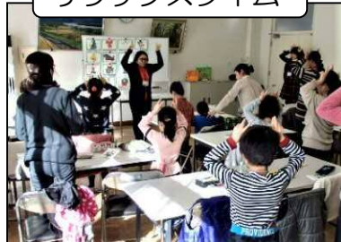
リラックスタイム