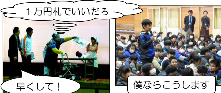
1万円札でいいだろ