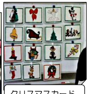
クリスマスカード

○1/7～15 左義長 ほとんどの地域で、恒例の左義長(どんど焼き)が行われました。