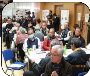
さあ、グループで話し合いです